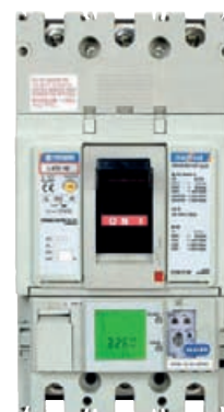
Disjuntor Eletrônico com Monitorização e Comunicação com proteção eletrônica contra sobrecargas, ajustável de 40% a 100% de In